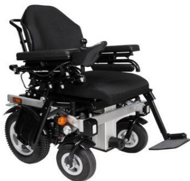
Carrozzina elettrica Swiss Viva